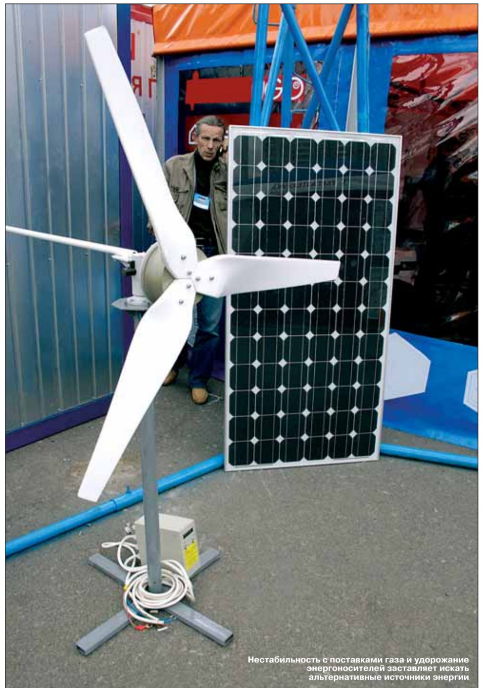
Нестабильность с поставками газа и удорожание энергоносителей заставляет искать альтернативные источники энергии

Если Вы решили приобрести солнечную систему или начать бизнес по этому направлению, я рекомендую обращаться за консультациями к специалистам в европейских компаниях.