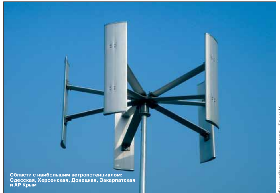
Области с наибольшим ветропотенциалом: Одесская, Херсонская, Донецкая, Закарпатская и АР Крым

Ветрогенераторы могут комбинироваться с любыми другими источниками альтернативной энергии. Такие установки можно использовать